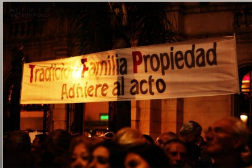
La Marcha de la Constitución y la Libertad